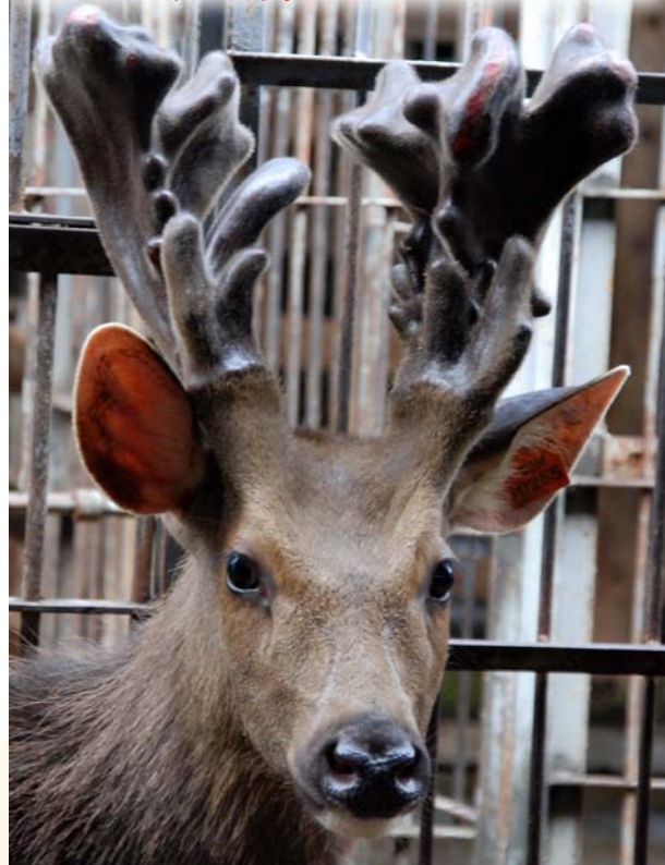
羅文政飼養耳牌03H265號 2016年頭剪121.3兩