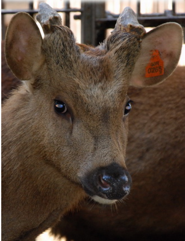
羅文政飼養耳牌03H265號 2015年串穗