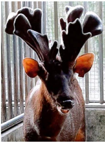
嘉義縣 翁明儀畜牧場 150