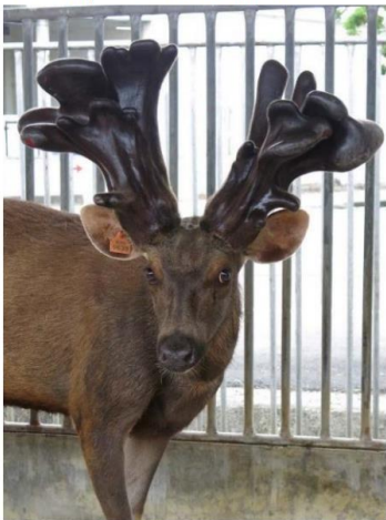
台南市 宏昌養鹿場 0633