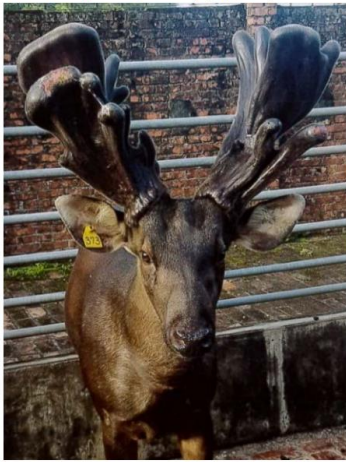
台南市 野山養鹿場 373