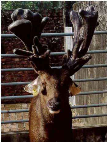
台南市 野山養鹿場 335