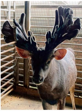
台中市 慶菖畜牧場 030-8024