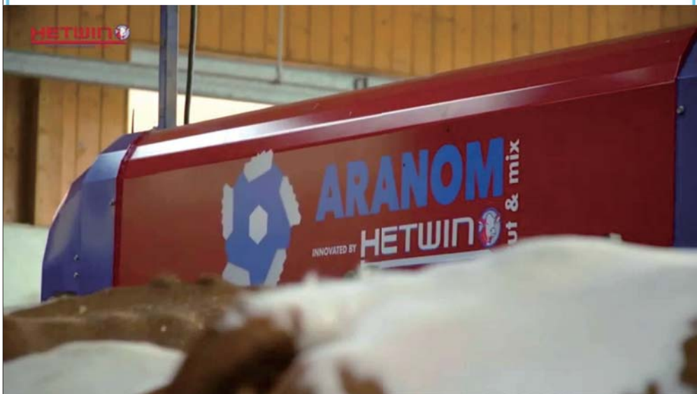
ORION afimilk 台灣奧利安產業股份有限公司 TAIWAN ORION INDUSTRY CO., LTD.