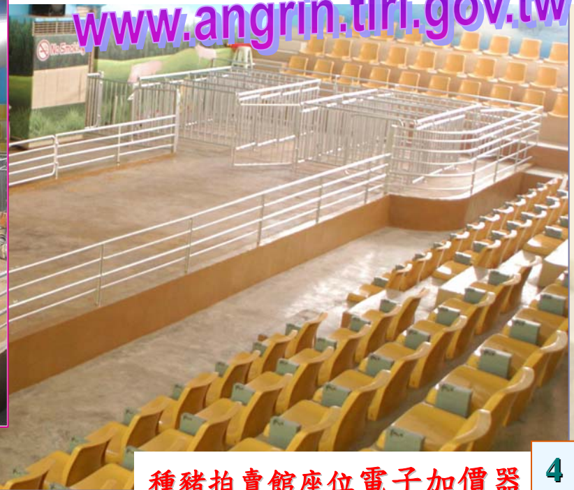
種豬拍賣館座位電子加價器