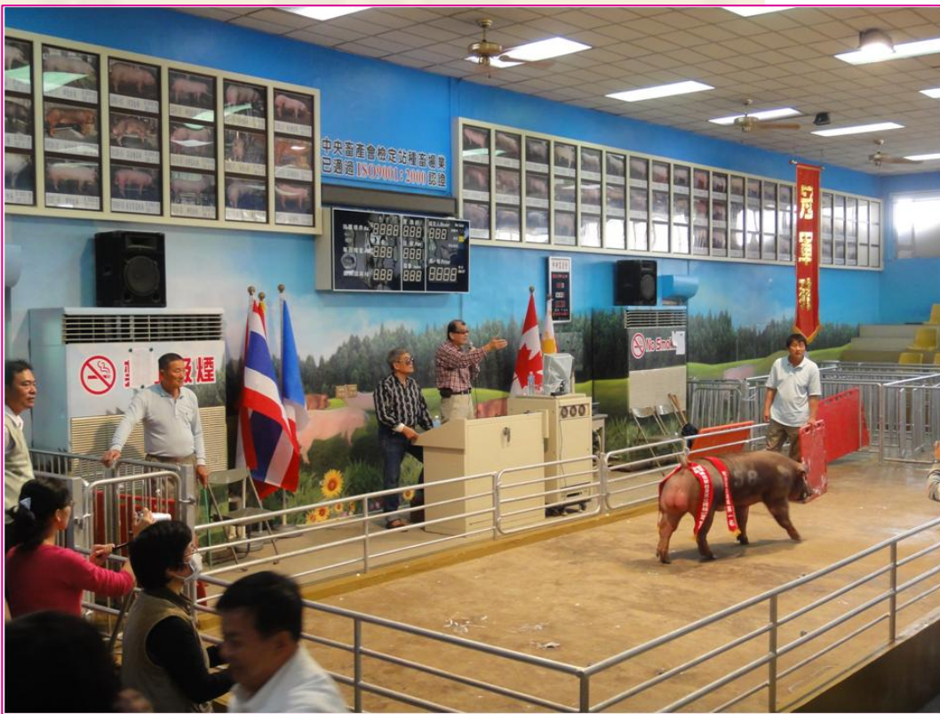
種豬協會比賽會種豬拍賣實境