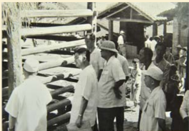
早期的木造鹿欄~堅固無比