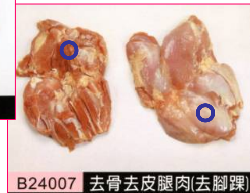
B24007 去骨去皮腿肉(去腳踝)