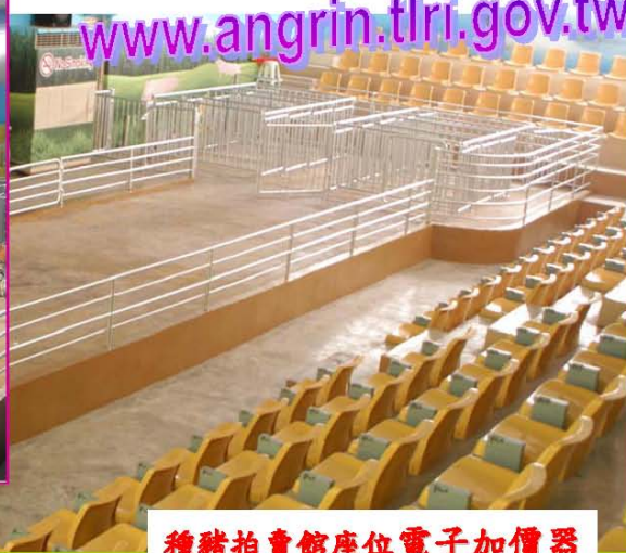
種豬拍賣館座位電子加價器