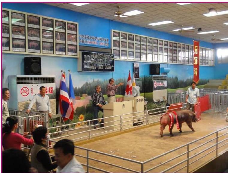
種豬協會比賽會種豬拍賣實境