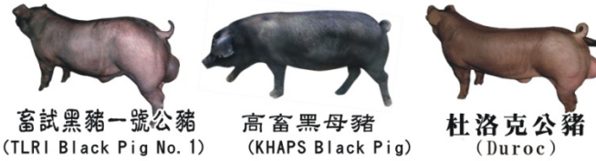
畜試黑豬一號公豬 (TLRI Black Pig No. 1)

彰化縣秀雅鄉漢寶村大同路625號 TEL: (04) 899-0327 FAX: (04) 899-0888