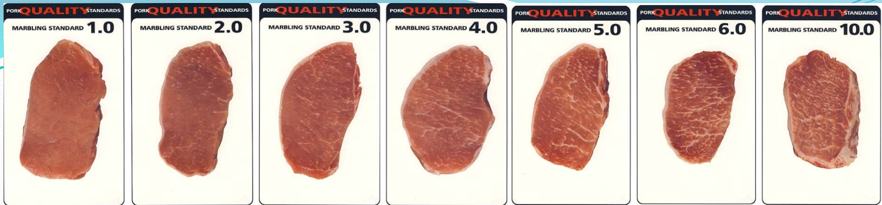
Figure 1 Pork marbling standards.