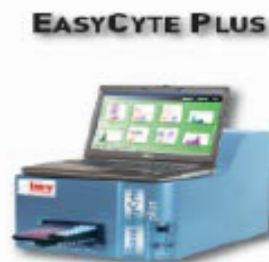
Compact EasyCyte R&D bench top Plug in/ Tubes and wells IMV CytoSoft IMV EasySoft Side scatter (optional)