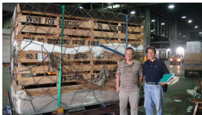
圖 1：水波種畜場於 2013 年（民 102）6 月 30 日出口 116 頭種豬到香港

本場於 1983 年（民 72）11 月起與大盈、王將、金龍等 4 家種豬場籌組白河種豬改良聯誼會，建立民間種豬聯合拍賣制度，將優秀種豬推廣給農民，增進農民養豬之效益，並於 1985 年起（民 74）開始拓展種豬外銷業務，使優良血統之後裔，遍及國內及越南、菲律賓、馬來西亞等東南亞地區及中國大陸、香港，賺取外匯為國增光。值得一提的是 1996 年（民 85）10 月 1 日包機（華航 747 貨機）出口 524 頭種豬到越南，前後經 30 多小時的運輸 524 頭種豬全部平安到達沒有任何損失，這也驗證篩選不含緊迫基因的功效。1997 年（民 86）臺灣發生口蹄疫情後禁止出口種豬，但本場於 2005 年（民 94）6 月接獲越南訂購種豬精液 5,000 劑之訂單，此為自 1997 年（民 86）3 月臺灣發生口蹄疫後，首次的種畜產品之外銷，意義非常重大。本場外銷種豬直到最近才於 2013 年（民 102）6 月 30 日再度出口 116 頭種豬到香港（如圖 1）。