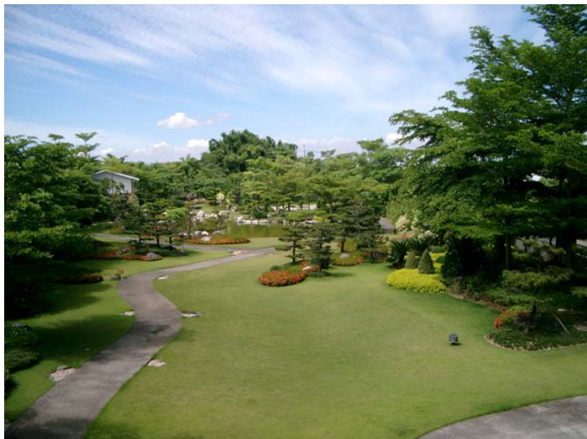
圖 3：水波種畜場場景 (本文出於種豬產業 60 年記事實錄)