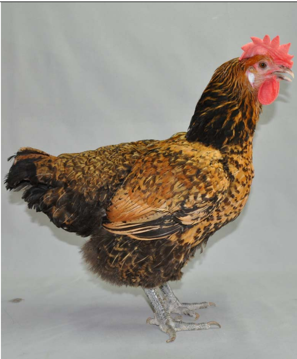
畜試土雞近親品系 12 母雞