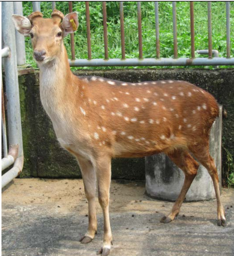
臺灣梅花鹿公鹿