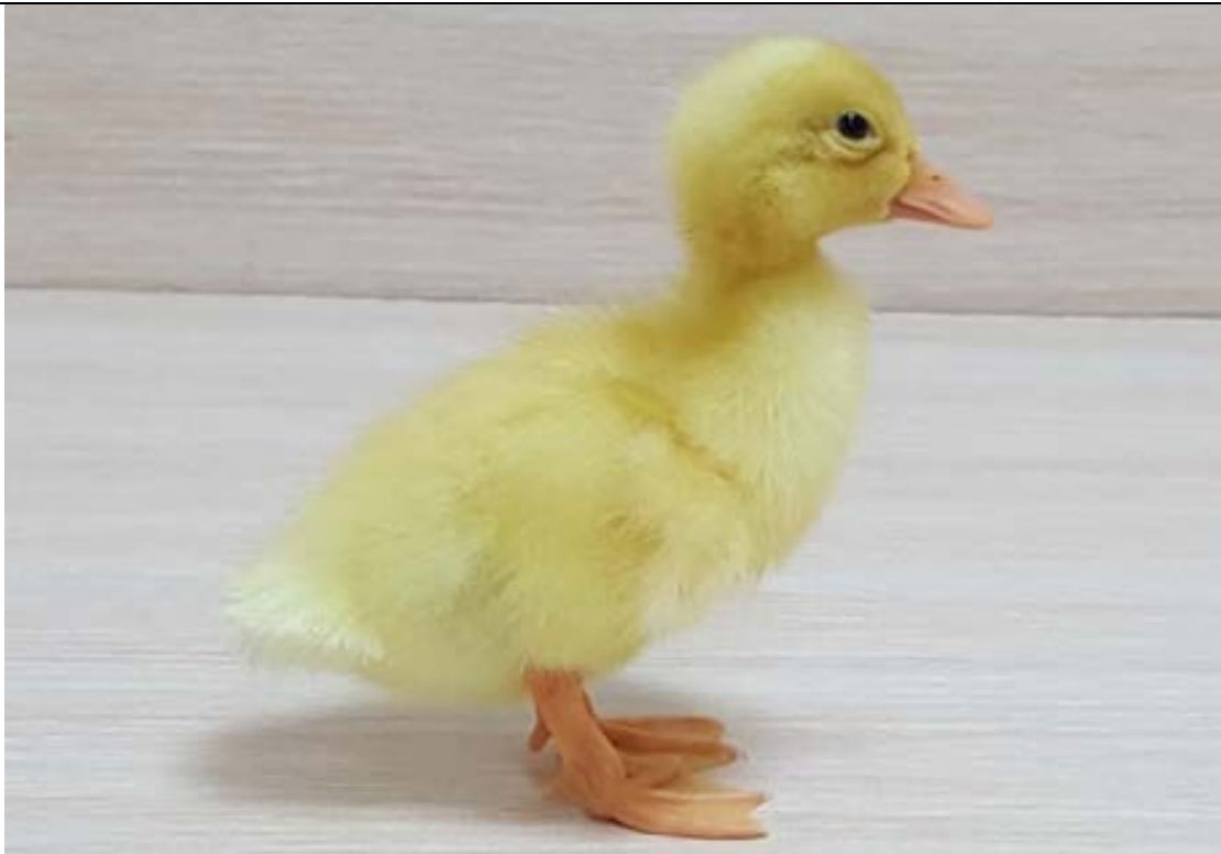
櫻桃谷鴨雛鴨外觀