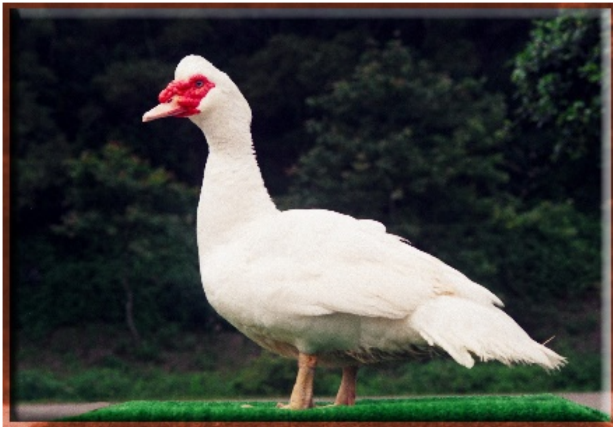
白色番鴨畜試1號公鴨