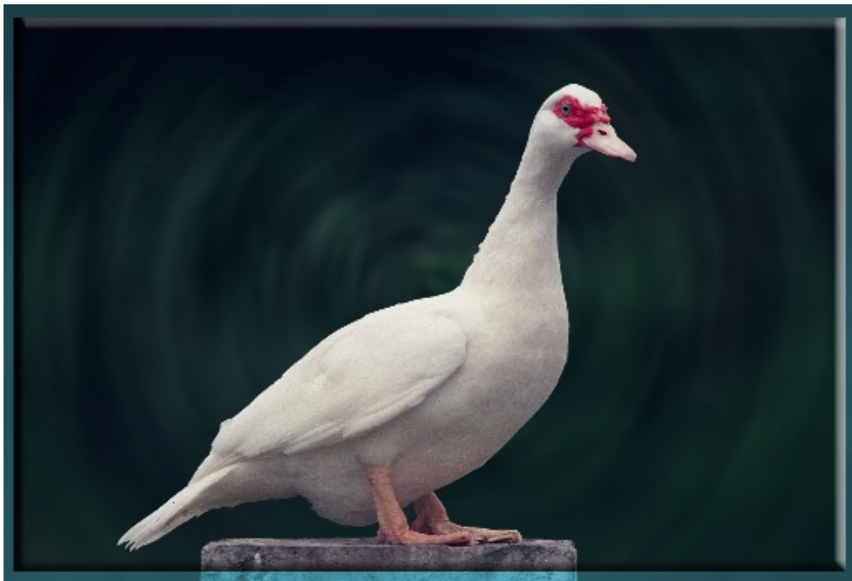
白色番鴨畜試1號母鴨