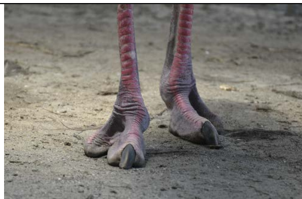
藍頸駝鳥足