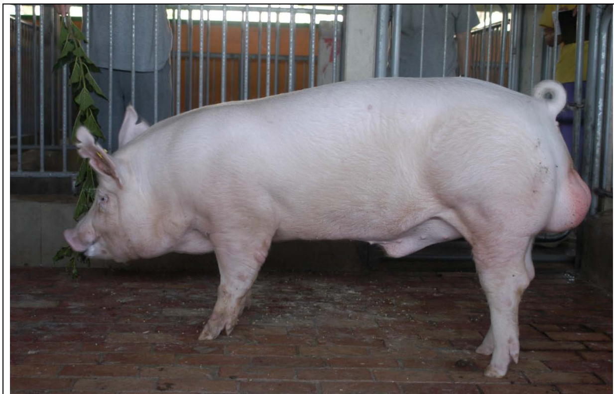
9月齡公豬