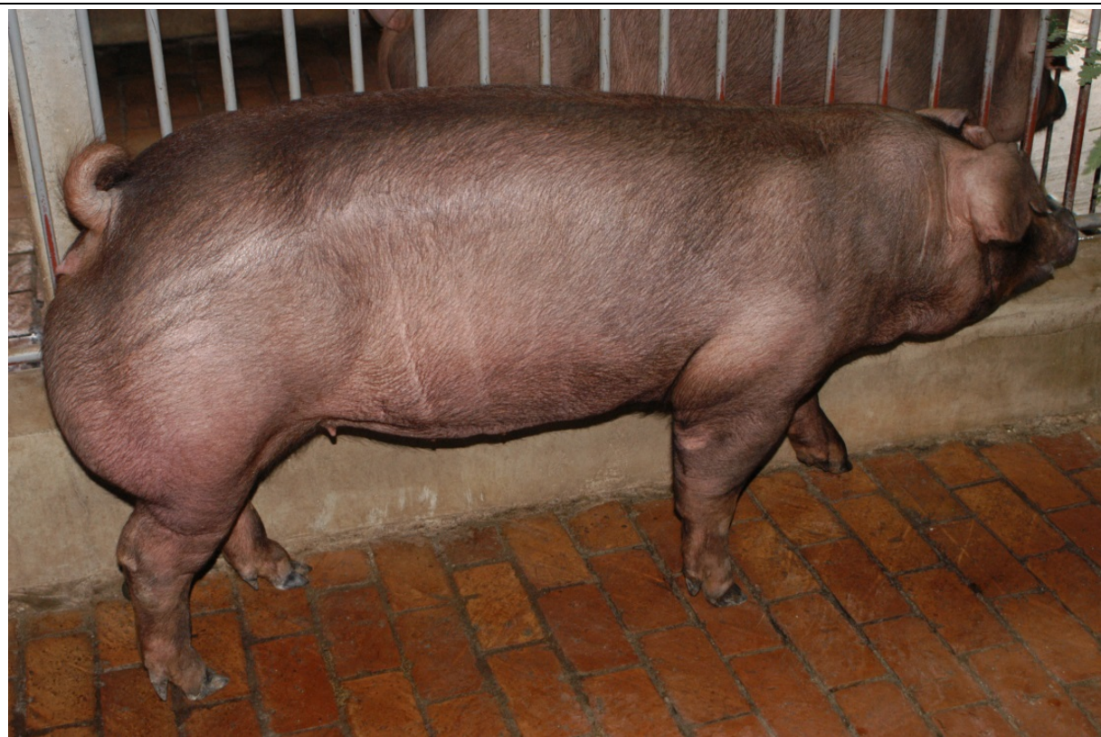
8 月齡母豬