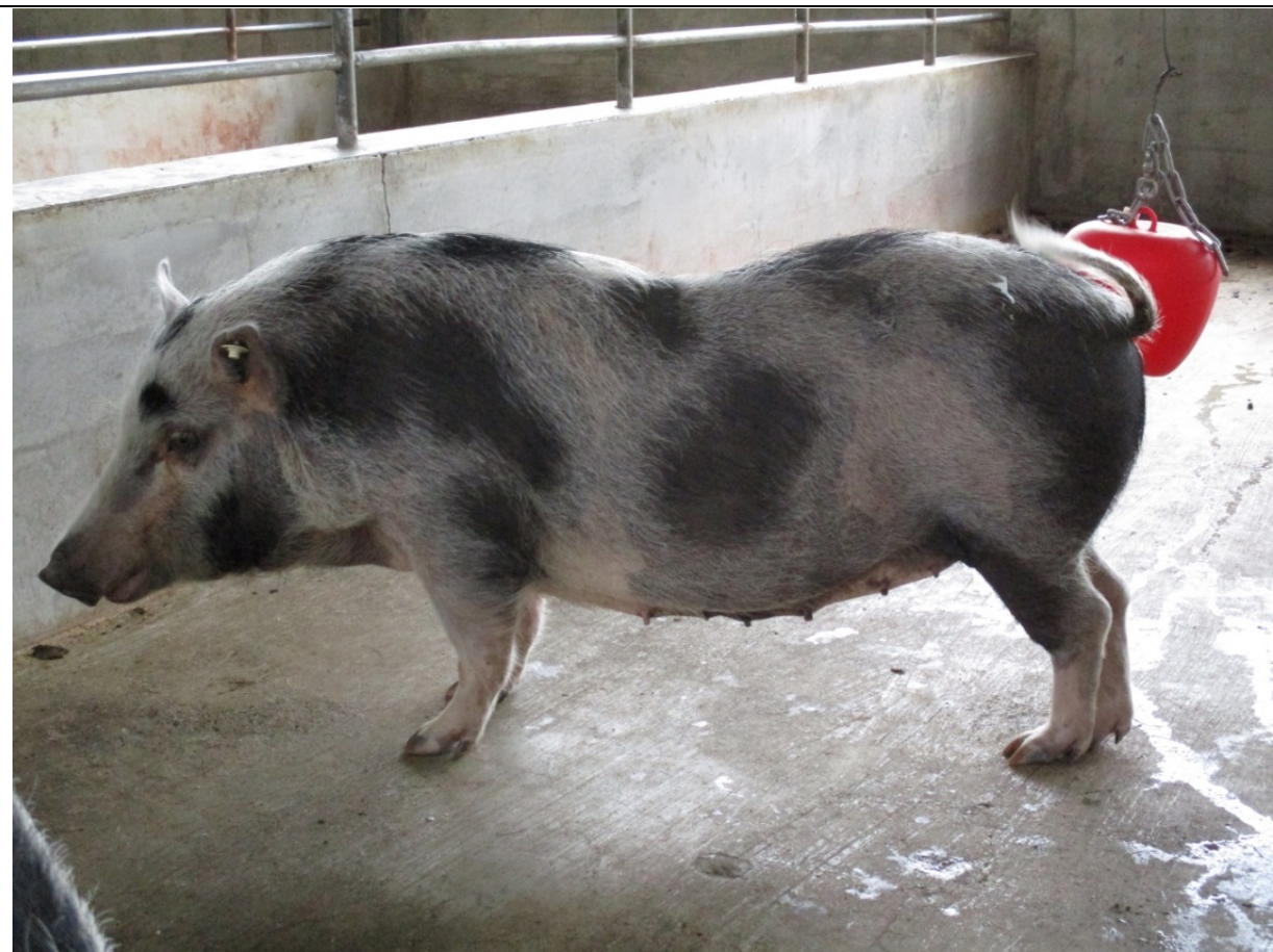
12 月齡母豬